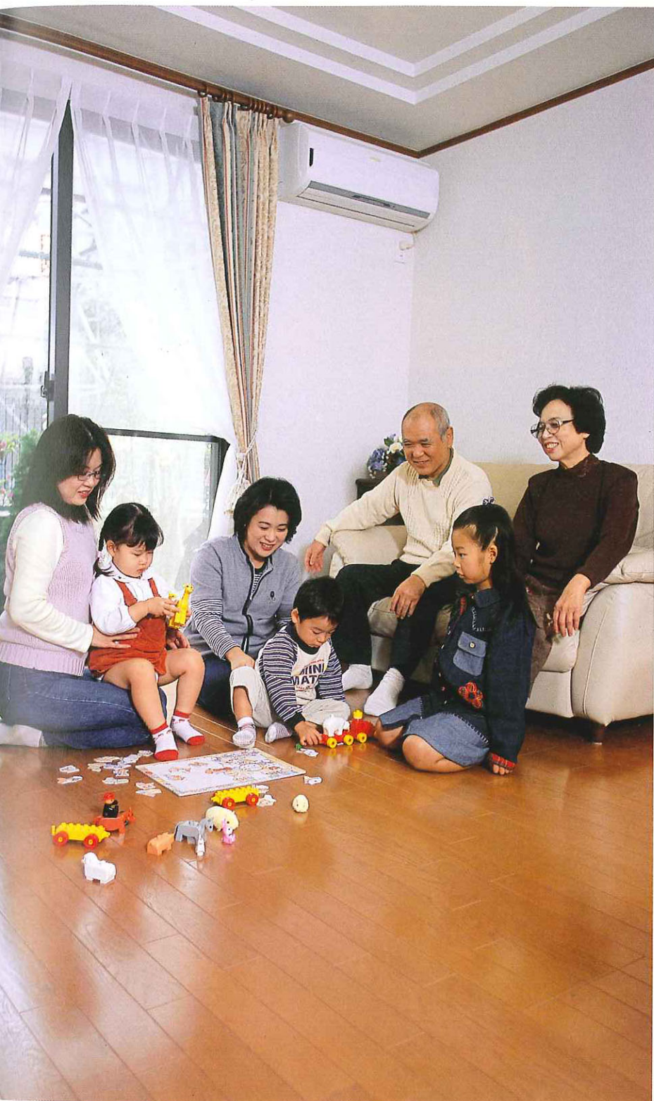
代と一緒に過ごす休日は、自然な暖かさがうれしいリビングで。輻射熱による快適性バツグンの電気式床暖房なら空気も汚れず小さなお子さんにも安心。

21世紀は、賢く、便利に、そして快適に暮らす時代。今回は、新しい暮らしのモデルケースともいえるオール電化の分譲住宅を手に入れて、充実した暮らしを楽しんでいるご夫妻に登場していただいた。